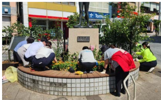
6月の植え替えでは、穂状に小花を咲かせる「アンゲロニア」、鮮やかな色合いの「マリーゴールド」を植えました