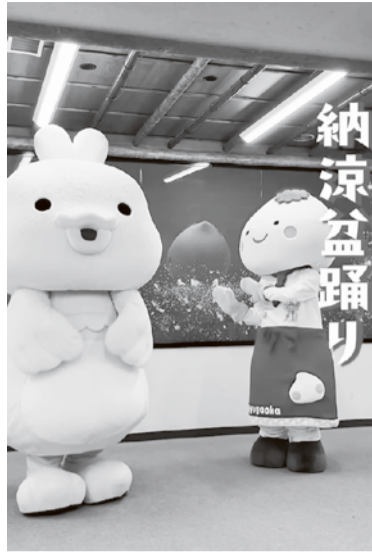
三菱UFJニコスのマスコットキャラ「トリ」と、「ホイップるん」がコラボ。盆踊り大会の練習風景をSNSで公開

丘オフィシャルウェブサイト」を中心に、公式SNSやYouTubeを組み合わせた形で情報を発信してきた。しかし、近年はSNSを通して情報を得るのが一般化していることから、同委員会では公式SNSアカ