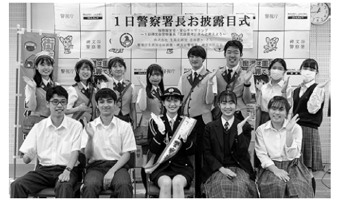
1日警察署長お披露目式