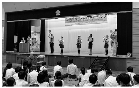
痴漢や盗撮、薬物乱用などの予防について学ぶセーフティ教室(6/21、都立桜修館中等教育学校)に登壇

由が丘圏で行われる防犯広報イベントにも多数参加。こうした活動が評価され、毎年、目黒区から感謝状が贈られている。