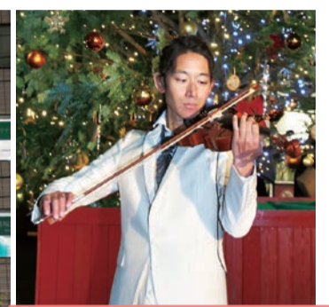
南口商店会 11/20 点灯式