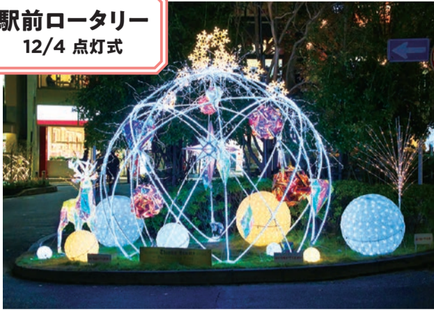
駅前ロータリー 12/4 点灯式