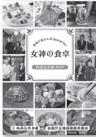
自由が丘の飲食店を紹介した新マップ「女神の食卓」(*写真はイメージ)

自由が丘商店街振興組合はウィズコロナ・アフターコロナを見据えた取り組みとして、商店街飲食店応援マップ「女神の食卓」を製作、2月上旬から自由が丘