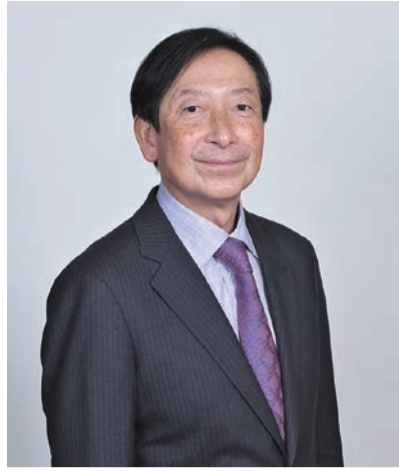
株式会社ジェイ・スピリット 代表取締役社長