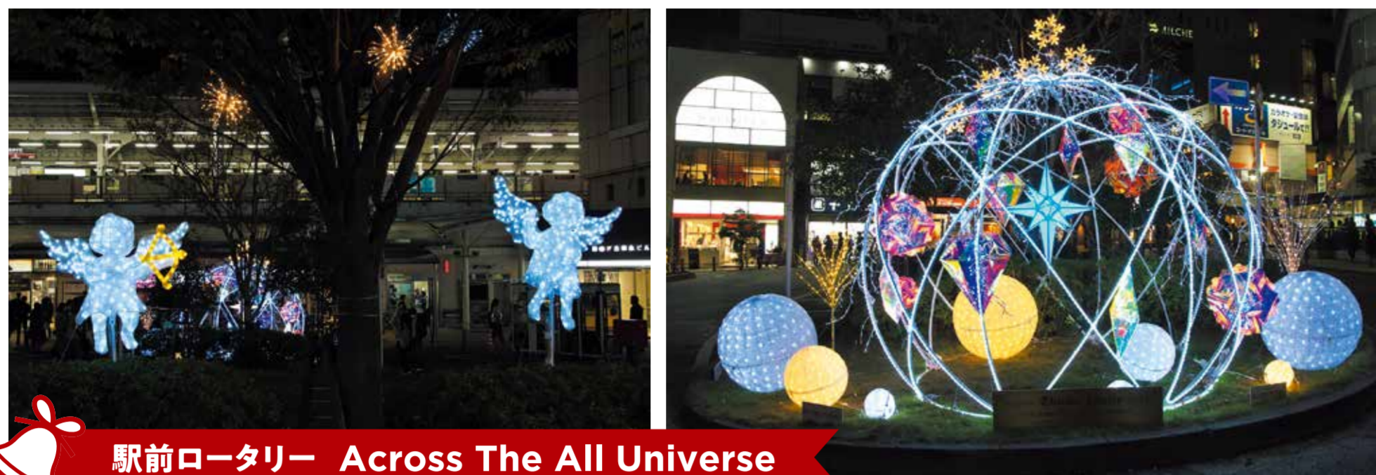
駅前ロータリー Across The All Universe

発行：自由が丘商店街振興組合 / 株式会社ジェイ・スピリット 協力：東京急行電鉄株式会社 / 自由が丘経済新聞 編集人：西村康樹・後藤良子 / デザイン：安部彩野 / ホイップるん作者：ササキミツコ