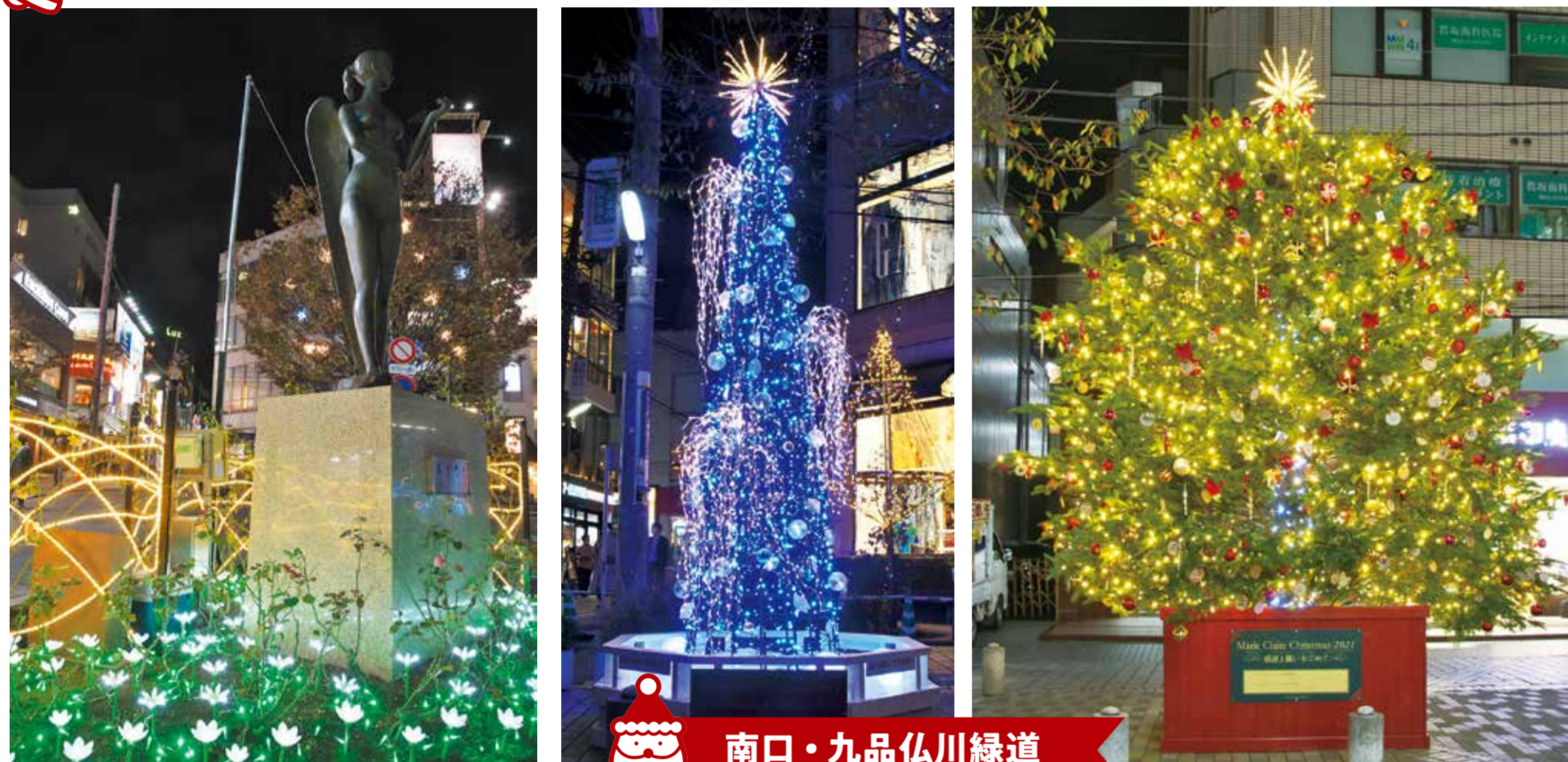
南口・九品仏川緑道