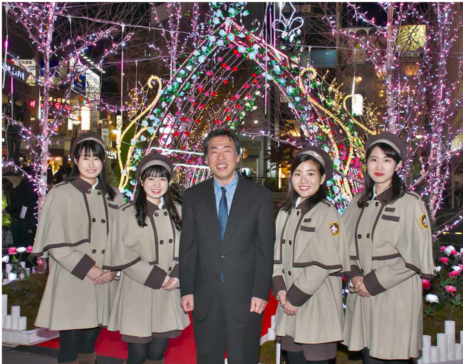
毎冬恒例のイルミネーションが現在、自由が丘駅前を鮮やかに彩っています。間もなくデビューする「自由が丘のバラ」にちなみ、バラ型のイルミネーションで装飾しました。街の案内人「セザンジュ」と共に自由が丘でお待ちしています。 *駅前イルミネーション点灯は「2月14日(金)」まで