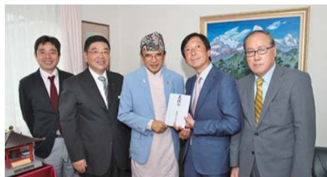
「目黒が大好き」と話すバットライ駐日大使(写真中央)

自由が丘商店街振興組合と南口商店会は8月20日、4月に大地震に見舞われたネパールを支援しようというイベントで募った義援金60万円をネパール大使館(目黒区)に届けた。