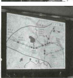
▲スクリーンに放映された自由が丘近辺の踏み切り箇所①