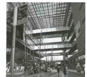
▲ S.C. カフコの特機とリバーフロント棟を結ぶ 1F ガレリア

駅からは雨にぬれずに、行け、カジュアルな品揃えの店が 15 店舗あり地下食品料店は広い。 ⇒ ガレリア ( ガラス天井の通路 ) を渡る真紅に自の自転車が目立つ! 「自転車から降りて押して歩いていい」とあった。