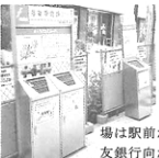
▲完成後、つまづく人が多く急遽撤去された喫煙用のボード(みずほ銀行前)

繰り返し話し合いが行なわれた喫煙所に関しては、三井住友銀行向かいに一箇所の設置となった。今後フェンスなどを設置する予定▼