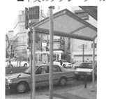
▲タクシー乗場はあまり位置が変わっていません