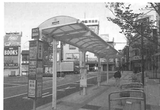
▲北側に移動したバス乗場