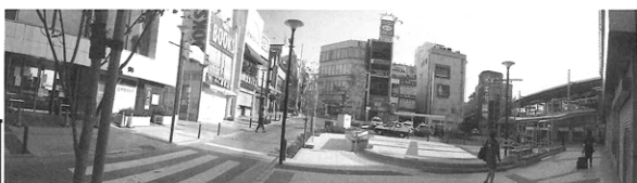
▲女神広場には、後日ベンチや植栽を置く予定

東日本大震災復興支援チャリティーイベント(5月3、4、5日)にはボードが収納され、大勢の生徒さんのプラズバンド、太鼓演奏やゴスペル合唱ステージとなり、タクシーブルまで広がった新広場は、大勢の観客の観覧スペースとなった。