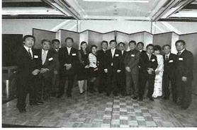
「私を支えて各事業に携わって下さっている現在活躍中の執行部の皆さんをご紹介します。非常に有能な方々です」

まず想像することが大事！ 発想しないと何も実現出来ません。発想したことを積極的に実現することです。