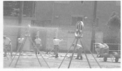
▲あ、灼の火の字に命中、..... 火の字が割れて、めでたく消火