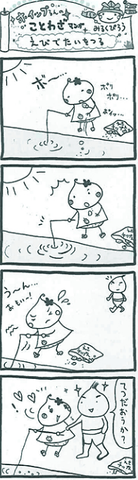
この美術館ではコンサー はできないのですから、こ

社員の中で最も長勤務 福のひとときだそう。こ しては二十歳か、企業オセナの一種として、 四十八年間、忠俊さんが平成二年にオープンした 社長になって間もなから、忠俊さんが長年 の良きパートナーだ。勤続かけてコレクションした 二十、三十年という人も、オール・ヌボのガラス 多く、また、時計が大好き、作品が常設展示されて なので、の仕事につけて、幸でもエール・カシの せですと語る若手の声も「しゃべりなげ文藝ラン 耳にした。