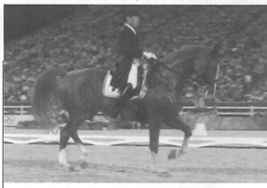
※ お並びと訂正 本紙前号で、法華津氏の法を誤と誤植するミスに鑑み、お詫び申し上げます。 詫び申し上げ訂正させていただきます。

うかがえます。 (1)と(2)についておきの、きのこの簡単レシピ!! (1) トマトとピーマン、椎茸と、3、4種類のきのこを用意します。小口切り、オリーブオイルでさっとソテーします。塩胡椒にんにくのみじん切りを加え、冷めたらオリーブオイルでマリネします。好みでレモン汁、パセリのみじん切りを加えればOK! (2) 冷やがてオードブルに、めて付け合わせにいかがでしょうか。