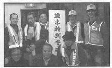
▲12月27日担当のひかり街・美観街の方々の勇姿です。