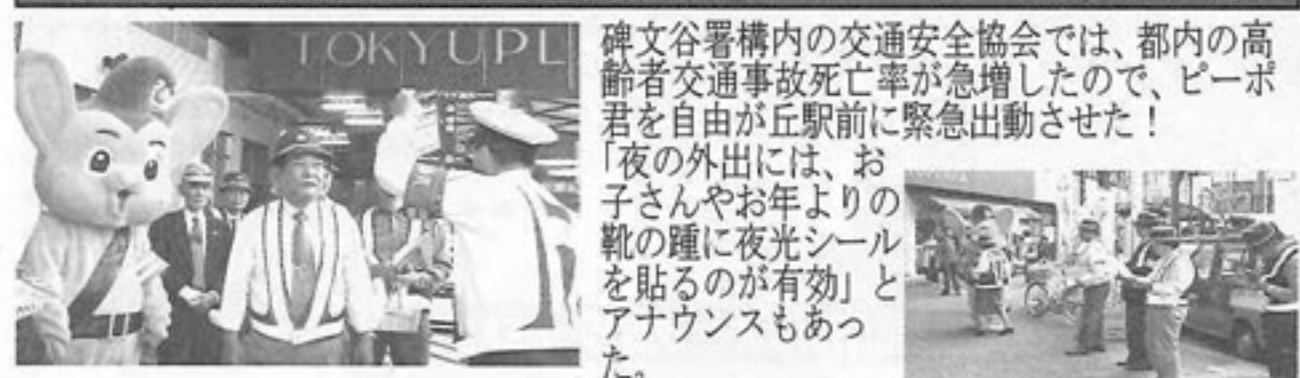
▲ピーボ君、竹中協会長、西園事務局長、説明する碑文谷署員 交通安全協会キャンペーン中▲