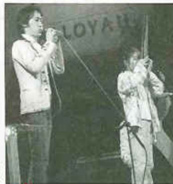
右写真撮影:近藤信治

その後会場を新しくオープンした「トレンチ」に移して祝賀会が行われた。目黒・世田谷両区長はじめ多数の来賓を迎えて、生まれ変わりつつある自由が丘駅の前途を祝して鏡割りが行われた。