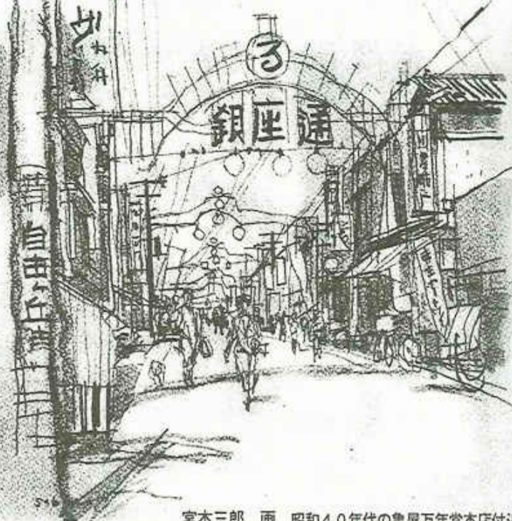
宮本三郎 画 昭和40年代の龜屋万年堂本店付近