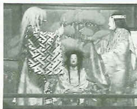
御神楽上演は9月2日午後6時から8時

3日(日)は午後1時に一の宮から三の宮(緑ヶ丘)の順でお神輿が熊野神社を出発し、駅前に集合する連合渡御で年に一度の例大祭はクライマックスとなる。神輿の担ぎ手は80団体(千五百名)に及ぶそうだ。