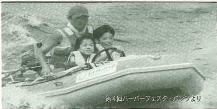
第4回ハーバーフェスタ・パンプより