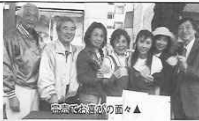
完成でお喜びの面々▲

今年のマリクレール フェスティバルから 自由が丘スイーツ系キャラクター ホイップるんが大活躍!