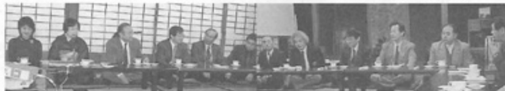
▲会津若松市での会津紀行の様子に